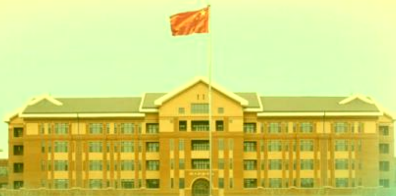
天津机电职业技术学院

TIANJIN VOCATIONAL COLLEGE OF MECHANICAL AND ELECTRICAL ENGINEERING